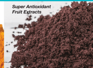
Extrait de fruits antioxydants puissants

Ce minéral guides un grand nombre des processus physiologiques et offrent plusieurs bienfaits sur la santé tels que cardiovasculaire, cerveau, système immunitaire, relâchement musculaire, santé osseuse, énergie et un activité de cellules-souches santé. Le citrate de magnésium est la forme le plus facilement absorbé de tous les sortes de magnésium.